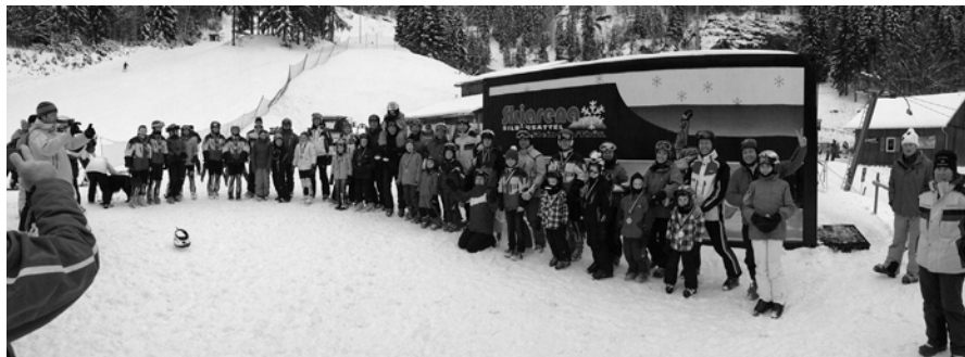
Siegerehrung des Mini-Max-Kombinations-Wettkampfs