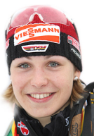
MAGDALENA NEUNER BIATHLETIN

„Ich spende, weil es gut ist ein Ziel vor Augen zu haben. Es ist schön, wenn so viele Menschen davon profitieren können.“