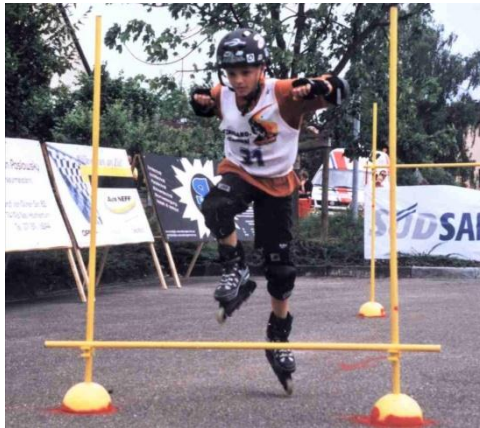
Übersteig- und Durchfahrstation

Dieses Übungsteil sollte aus 1 Übersteig-, als zweites 1 Durchfahr- und als drittes aus einer Übersteigstation. Höhe der Übersteigstation min. 20 cm, max. 40 cm, Breite min 100 cm, max. 150 cm. Abstand der 3 Stationen jeweils 1,50 m bis 3 m. Abstand der drei Hindernissen jeweils 1,50 m bis 3 m . Höhe der Durchfahrstation 100-150 cm.