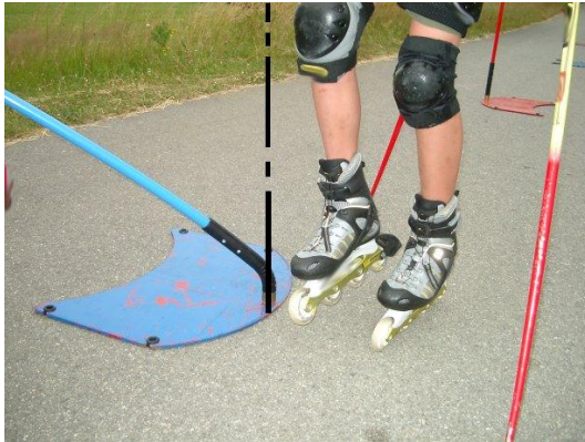
Gut – kein Torfehler !

Ein Torfehler liegt vor, wenn sich an der Torstange ein Teil eines Inlineskates über der gedachten Senkrechten der Torstange befindet!