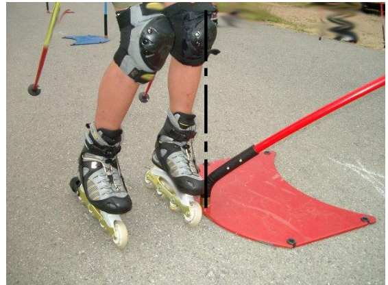
Skates am Boden – kein Torfehler !