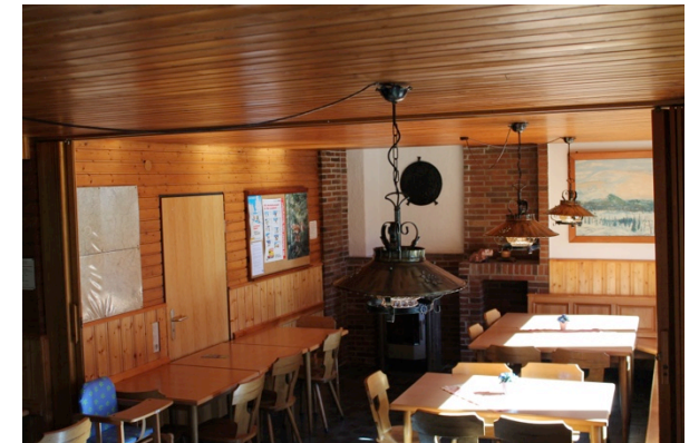
Tagesraum / Kaminzimmer